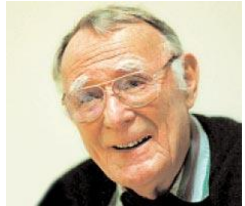
Основатель ИКЕА Ингвар Кампрад

Предлагаемая продукция имела четкие дифференцирующие черты. Все было простым, качественно сделанным, по-скандинавски элегантным. Все продавалось в разобранном виде для самостоятельной сборки покупателями, что снижало цену и срок доставки из магазина (чем отличаются другие мебельные фирмы). Огромные пригородные магазины имели огромные парковки, рестораны, детские игровые комнаты, инвалидные кресла и т.п. Покупатели ожидали стиля и качества по разумным ценам. ИКЕА реализовала эти ожидания, предоставляя покупателям возможности самостоятельного создания ценности путем исполнения функций, традиционно отдаваемых производителю или продавцу: например, доставка и сборка. Разумеется, это также снижало издержки. Также на это работало и то, что покупателям в торговом зале выдавались бумажные «метры», карандаши и блокноты для записей – требовалось меньше продавцов.